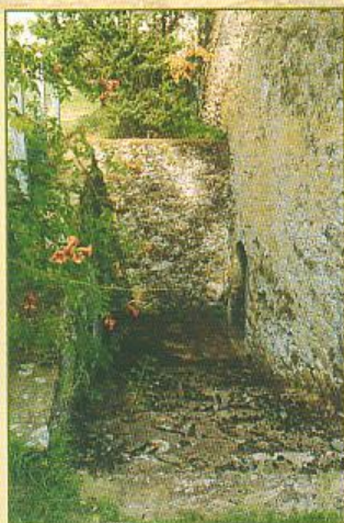
▲ L'escalier de la cave de la Basse Gémérie

Un habitant d'Yvré offre une pipe de vin de Saumur à son oncle, le frère Regnault, la communauté payant le transport. Ce vin, en plus de sa saveur doit être renommé pour ses qualités thérapeutiques. Les "nottonniers" de Saumur connaissent notre région, leurs bateaux à fond plat remontent la Sarthe et l'Huisne en étant tiré "à col", par des hommes, le long du chemin de halage. La traction par des chevaux coûte trop cher.