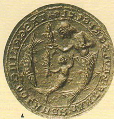
▲ Le sceau des nautonniers de Cunault

Tout près, une "sirène-fille" offre beaucoup de similitude avec sa mère, mais aussi une personnalisation de la jeunesse. Face à cette scène familiale et sans doute éducative, un très beau saumon, ce