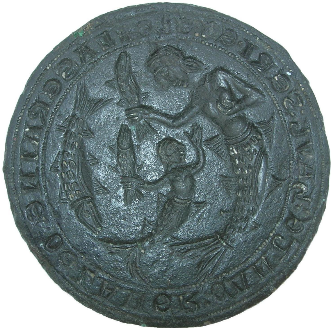
FIGURE 3 – Matrice du sceau des sirènes (agrandie)