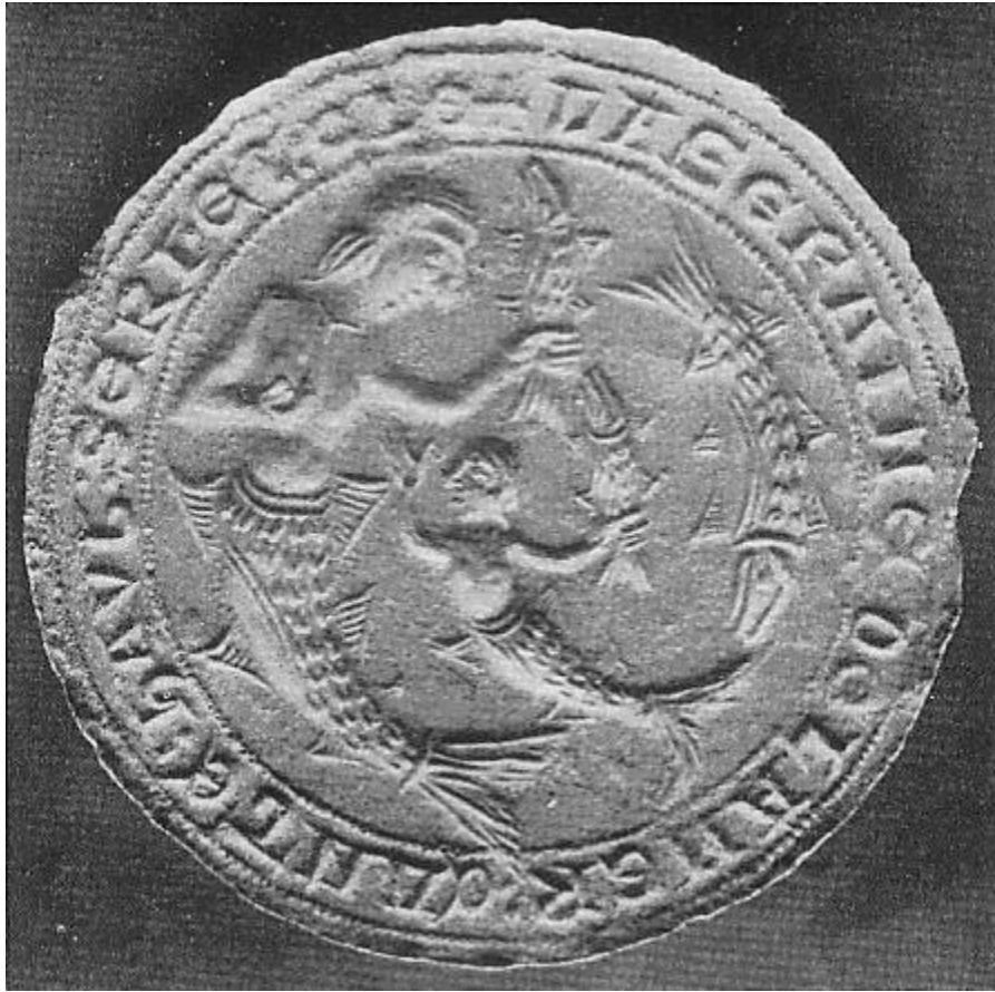
FIGURE 2 – Empreinte de la matrice du sceau des sirènes (agrandie)

Mais revenons à notre sirène-mère, un instant, le bras gauche est à moitié tendu et la main soutient tout dressé à la verticale, un poisson à la jolie tête, assez réaliste, sans doute un saumon... Penchée, notre sirène l'offre, ou le tend à sa petite sirène-fille, qui, elle lève main et bras droits vers sa mère; le visage de profil vers dextre (notre g.) est assez gros, épais; quelques cheveux sur le derrière de la tête et de la nuque qu'elle relève légèrement vers sa mère à qui elle semble offrir du bras et de la main gauche un assez gros poisson, à moins que ce ne soit le contraire, et que ce soit la mère qui le lui ait passé... Le haut du corps, de face, est nu; deux petits seins bien ronds s'y trouvent; la taille bien marquée a une petite ceinture double comme chez la mère, mais, évidemment réduite. La gaîne ou corps aquatique est petite; elle se termine par un petit anneau et la queue de poisson, petite, fine, aux deux touffes très écartées, ouvertes en quelque sorte. Deux petites paires de nageoires en très plat bas-relief. - Notons, qu'ici, chez la fille, la sorte de 'bouclier' ou petite 'plage' se trouve sur ce qui pourrait être le ventre de profil, et non la cuisse comme chez la mère.