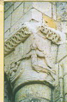
▲ A Cunault une sirène sculptée sur un chapiteau extérieur du clocher de l'église.

Si l'église de Cunault est une perle angevine du patrimoine architectural et si elle est visitée par de nombreux touristes bénéficiant d'un fond musical mélodieux, beaucoup plus modestement, le chemin des Rieux à Sargé est parcouru par des randonneurs attirés par un paysage bucolique peuplé de légendes et à l'écoute du chant envoûtant des sirènes faisant écho aux chants des oiseaux et aux bruissements des feuilles agitées par le vent.