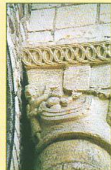
▲ Sur le même chapiteau, face à la sirène, un bateau et ses bateliers