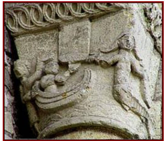
FIGURE 1 – Chapiteau d'une colonne du clocher de Cunault

- page 132 : Le XVIII e siècle fut le grand siècle de la seigneurie de Trèves. ... En ce temps-là, le seigneur de Trèves avait 'droit de prélever sur les pêcheurs de la Loire le premier saumon pris dans l'année...'